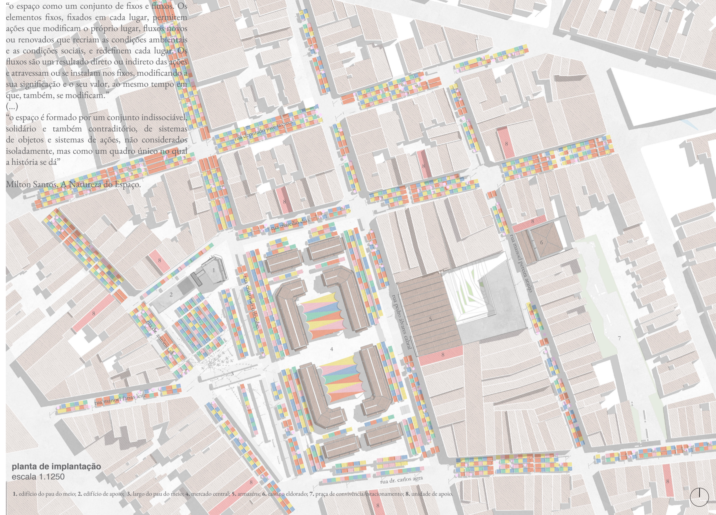
planta de implantação escala 1:1250