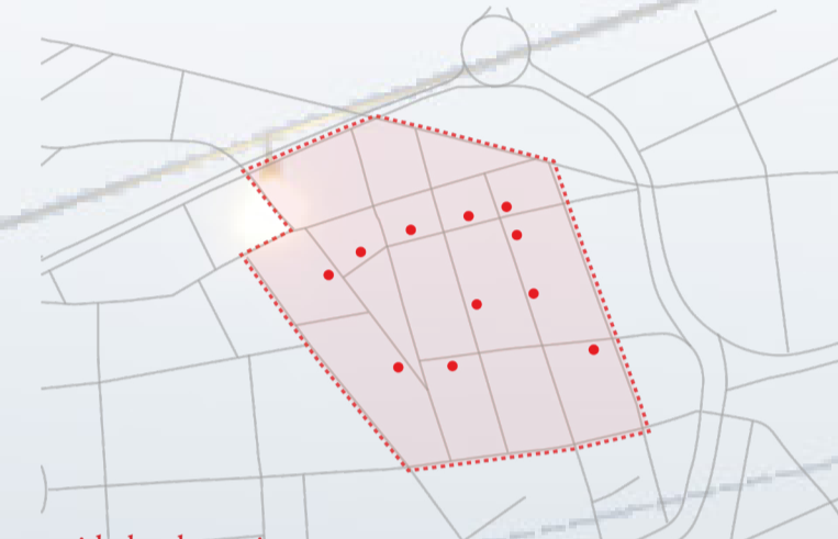
unidades de apoio sanitários, armazenamento, descanso, habitação social