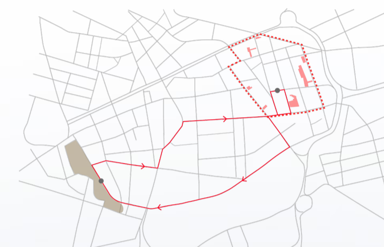
patrimônio ampliação da área de proteção rigorosa (incluindo a Feira)