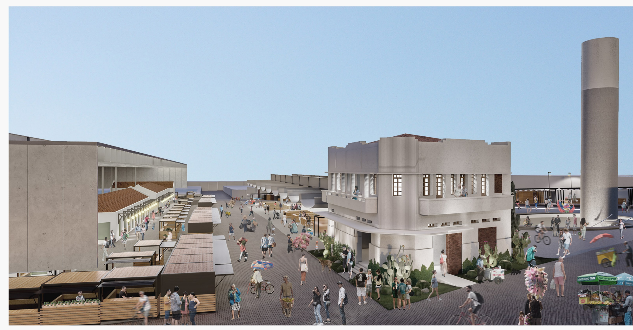
Edifício do Pau do Meio