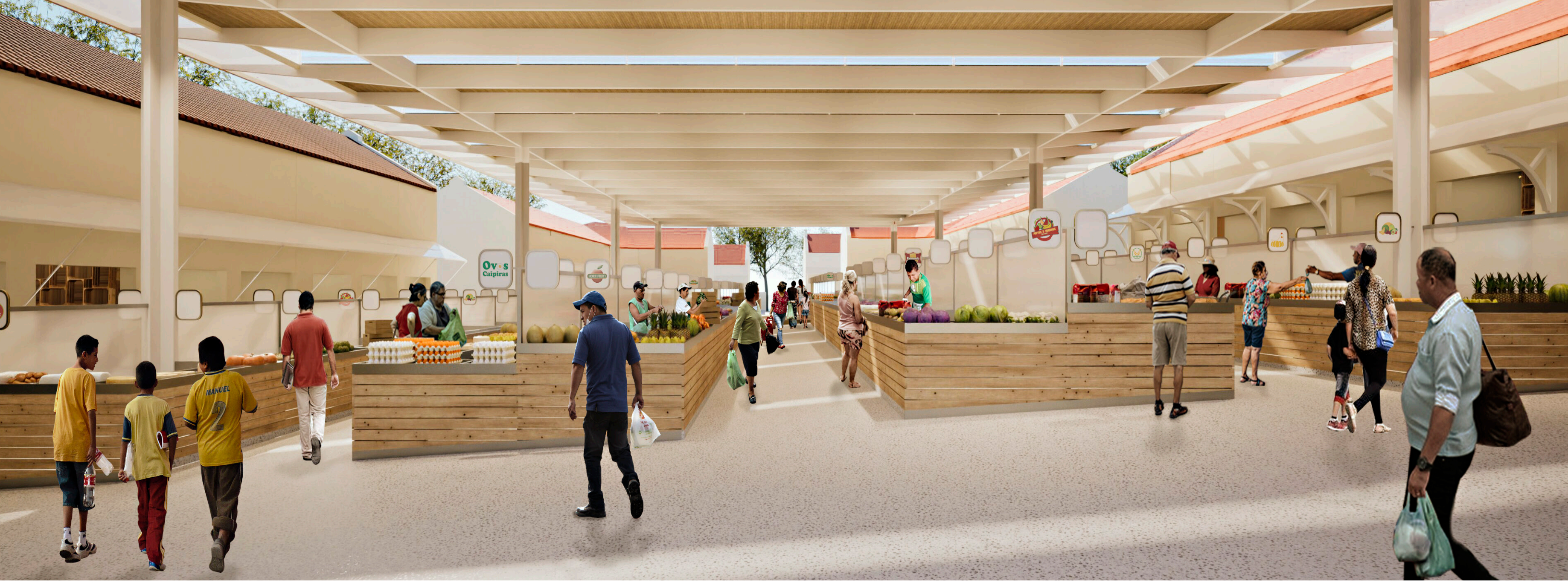
PERSPECTIVA 01 - Imagem geral do Mercado Central