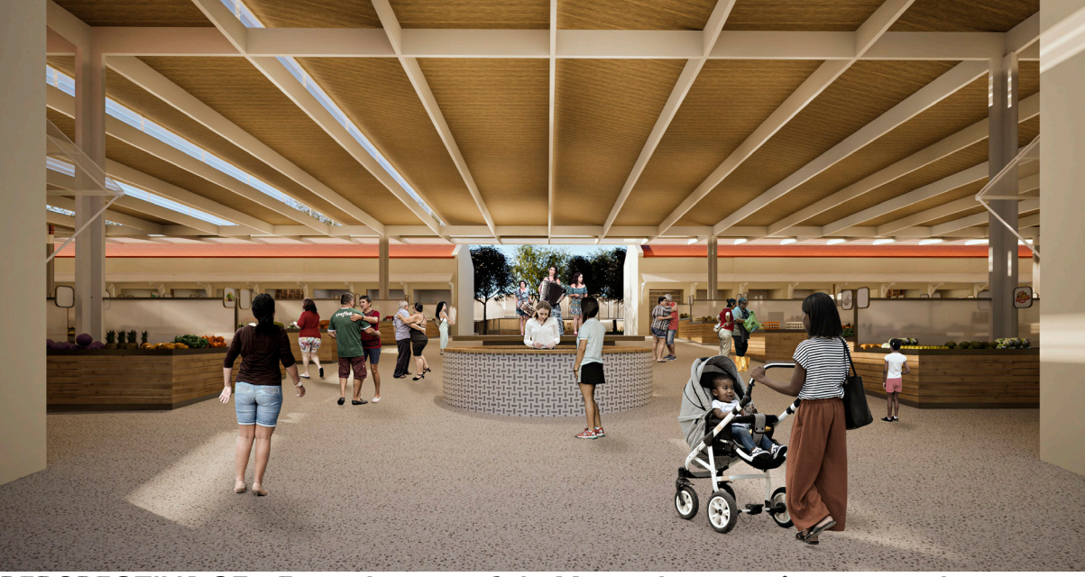
PERSPECTIVA 03 - Entrada central do Mercado com vista para o Largo