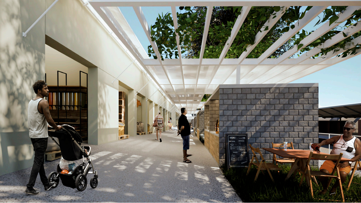
PERSPECTIVA 02 - Lateral do Mercado com vista dos bares