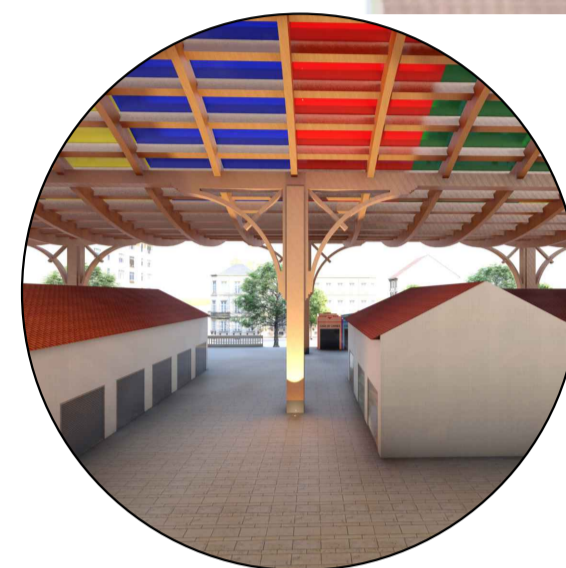
Design dos pilares inspirado na mão francesa