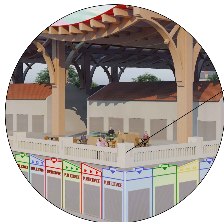
Recuperação dos balaustres

O Pátio Cultural , localizado no centro do Mercado, é dividido em dois ambientes. O primeiro, com 350 m 2 , é destinado a apresentações culturais, como danças e shows. O segundo ambiente, com 100 m 2 , pode ser utilizado para palestras, cursos e manifestações culturais, como poesia e grupos musicais. Entre os dois pátios, encontram-se as salas de apoio e o centro de atendimento ao turista.